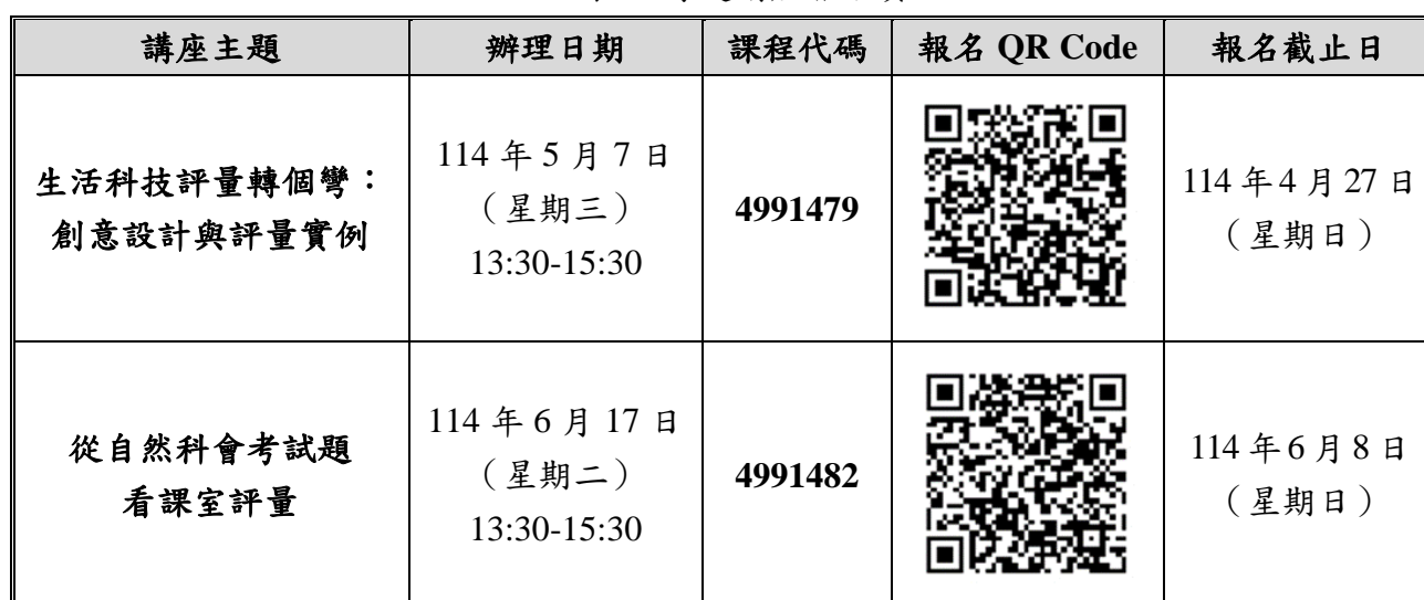
表 2 專題講座報名資訊